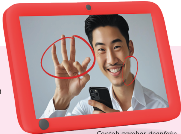
Contoh gambar deepfake